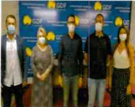
Alinhamento das ações de trabalho para melhorias de Samambaia