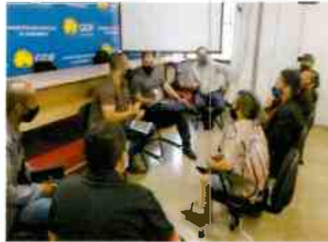
Reunião com Galpão do Riso